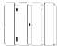
fessurazione tipo 2